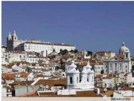
Barrio de Alfama, Lisboa

*Avisa a tus amigos: quizás no regresen nunca.